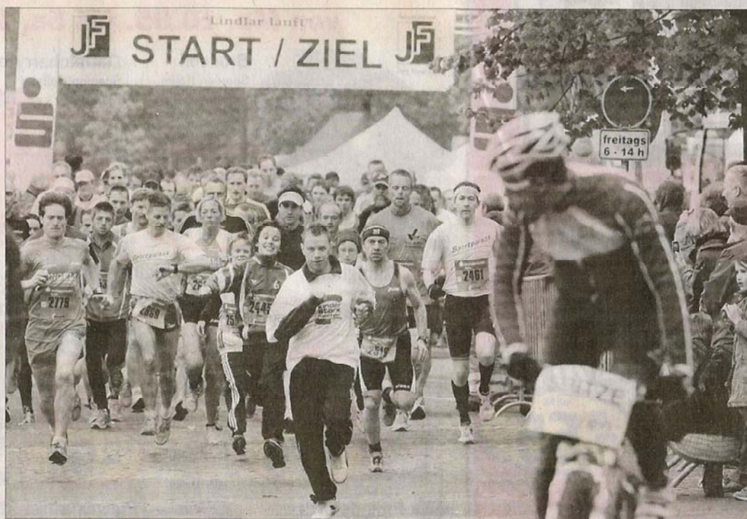
Lindlar läuft: Zum dritten Mal fand am Freitagabend der Lindlarer Ortskernlauf statt. Bambini, Schüler und Ausdauersportler eilten über Kopfsteinpflaster und Kreisverkehre.